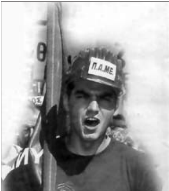
Ein Kämpfer der kommunistisch geführten Arbeiterzentrale P.A.M.E.