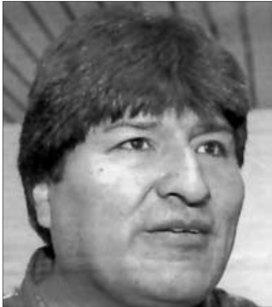
Der Führer der MAS Boliviens, Evo Morales, steht an der Spitze einer sich entwickelnden indianischen Revolution.

Am 18. Dezember soll im südamerikanischen Andenstaat Bolivien abermals gewählt werden. Nach Umfragen liegt die linksgerichtete und vor allem von der indianischen Bevölkerung getragene Bewegung zum Sozialismus (MAS) gut im Rennen. Sie verfügt schon jetzt über 27 von 130 Abgeordneten und über 8 von 27 Senatoren des Nationalparlaments. Ihr Kampf und Widerstand hat im letzten Juni einen korrupten Präsidenten zum Teufel gejagt und später dessen Nachfolger ebenfalls vertrieben. Nach Meinungsumfragen könnte die MAS mit mindestens 40 % der Stimmen rechnen. Ihr Führer, der Aymara-Indianer Evo Morales, ist ein Bewunderer