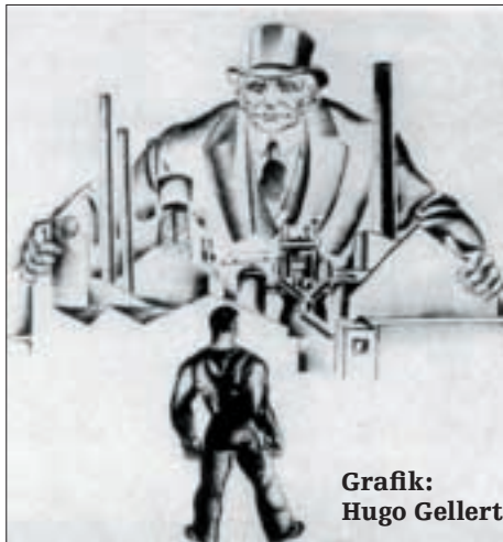
Grafik: Hugo Gellert

In „Initiative Communiste“, der Monatszeitschrift des „Pols für die kommunistische Wiedergeburt in Frankreich“ (PRCF) – ideologisch standhaft gebliebener Genossen der FKP –, erschien unlängst ein interessanter Artikel unter der Überschrift „Einheitsfront und Klassenkampf – welche Lehren ziehen wir aus dem VII. Kongreß