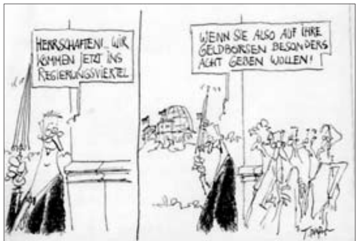
Aus „ver.di News“