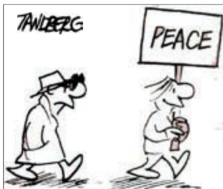
Aus „The Guardian“, Sydney

R. F., gestützt auf „The Guardian“, Sydney