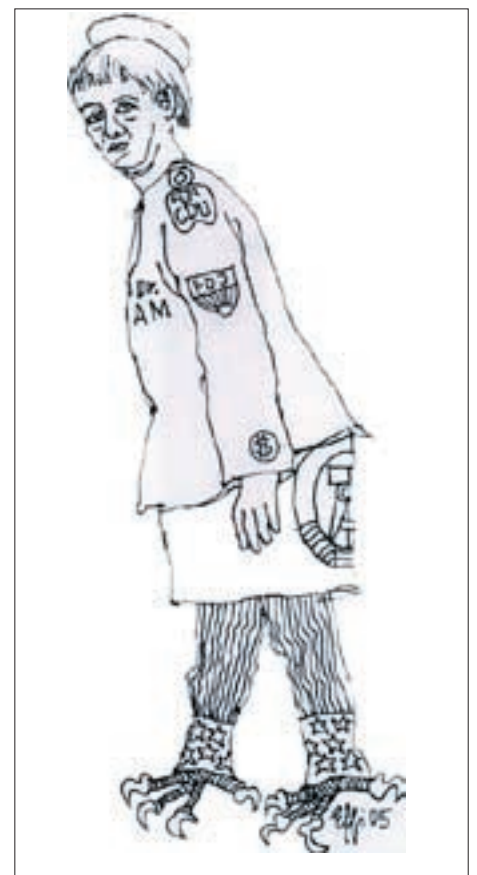
Grafik: Karlheinz Effenberger

Tatsache ist, daß die Sandsteintrümmer der Frauenkirche geborgen, numeriert und gelagert wurden, um einen späteren Wiederaufbau zu ermöglichen. Ziel der Antifaschisten an der Spitze der Stadt, die ihr Leben eingesetzt hatten, um die Zerstörung Coventrys, Warschau und Dresdens zu verhindern, war von Anfang an, das Historische und Spezifische Dresdens zu bewahren. Sie trafen sich dabei mit den Befehlen der sowjetischen Besatzungsmacht. Um die Doppelzüngigkeit der Herausgeber der „Sonderausgabe“ der Springer-Zeitung zu belegen, genügt es, in der anderen Beilage, dem sechsseitigen „Extra“, zu blättern, das auf das „Wunder von Dresden“ folgt. Darin wird berichtet, etwa 350 Wehrexperthen aus aller Welt seien am 24./25. Oktober Gast der Zeitung im Berliner Axel-Springer-Haus gewesen. Da ging es schon um den nächsten Krieg. Der Generalinspekteur der Bundeswehr habe gefordert: „Die Bundeswehr muß Schritt halten.“ Wo werden die Ruinen stehen, die die Dresdens an Schrecklichkeit noch übertreffen würden? Wer erinnert sich nicht an Brechts Mahnung „Das große Karthago ...“? Prof. Dr. Horst Schneider