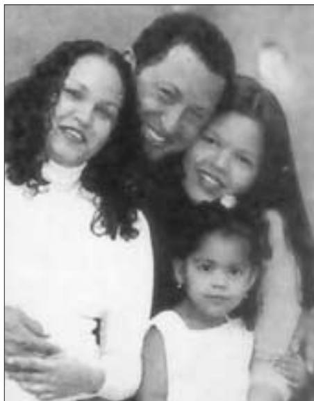
Hugo Chávez mit seinen drei Töchtern

oder den vom Imperialismus begangenen Menschenrechtsverletzungen. Es gab 32 offizielle Veranstaltungen sowie Fahrten in verschiedene Regionen des Landes, bei denen man sich vor Ort über die Verbesserungen, die unter Chávez für die arme Bevölkerung geschaffen wurden, informieren konnte. Überall im Land war zu