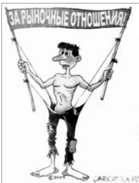
Für marktwirtschaftliche Verhältnisse! Aus „Trudowaja Rossija“

Armin Stolper. Mit Bismarck nach Bad Kissingen & Mit Heine im Kastanienwäldchen , GNN Verlag, Schkeuditz 2005, 292 S., 15 €, ISBN 3-89819-207-5