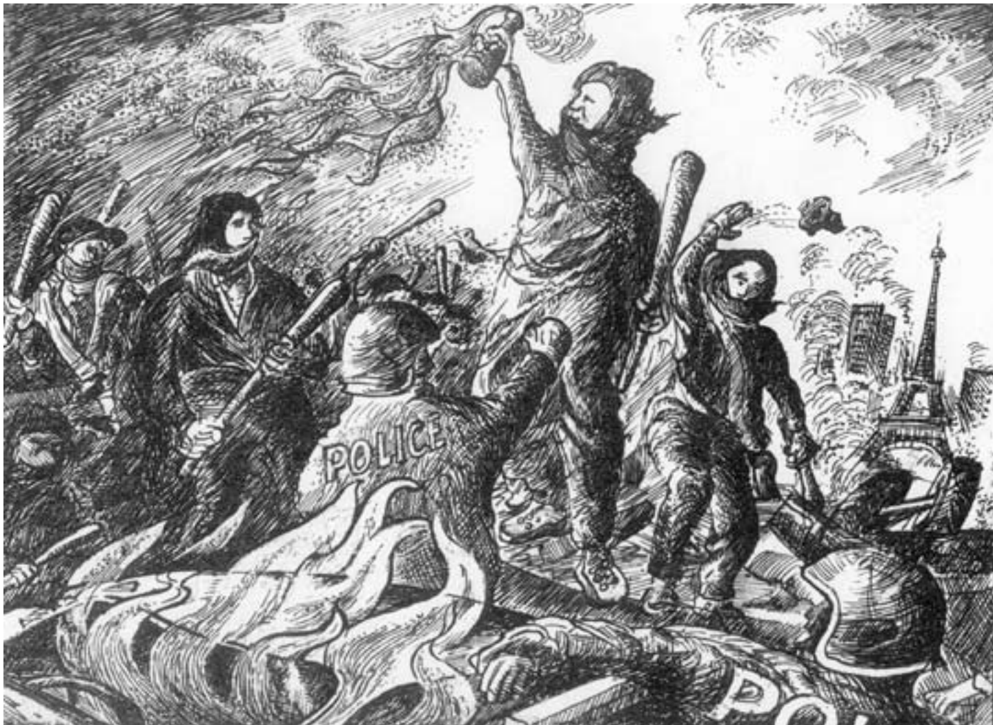
Der Aufschrei! (Frei nach Eugène Delacroix)