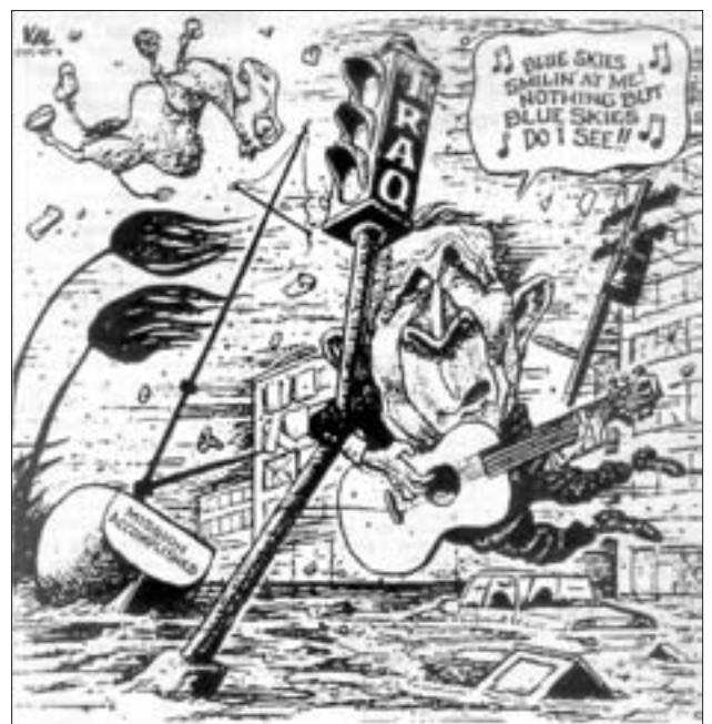
Ein Kriegstreiber in Nöten Aus „The Baltimore Sun“