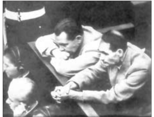
Göring und Heß bei der Eröffnungsverhandlung des Tribunals

Faschismus angegriffen und okkupiert wurden. Der Internationale Gerichtshof sah sich in diesem Prozeß nicht als zuständig an, die Verbrechen der faschistischen Herrschaft gegen die eigene Bevölkerung zu ahnden. Man ging jedoch davon aus, daß mit dem Verfahren Rechtsmaßstäbe gesetzt würden, auf deren Grundlage später deutsche Gerichte die Verbrechen gegen Deutsche selbständig verfolgen könnten.