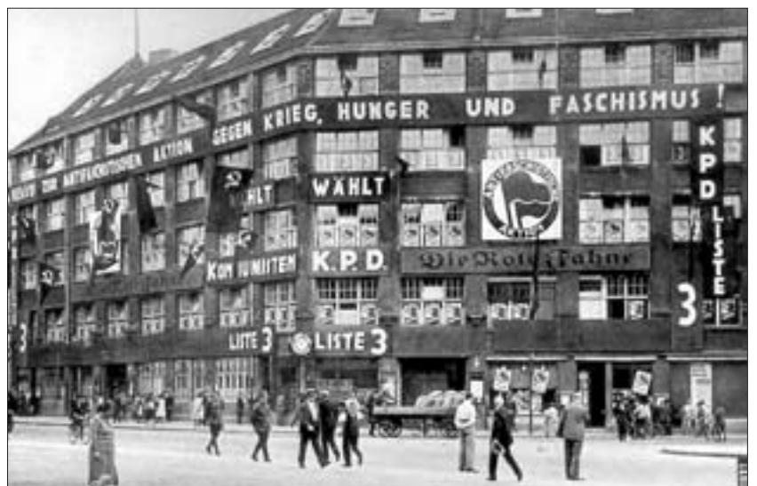
Im Berliner Karl-Liebknecht-Haus befand sich bis zum Januar 1933 der Kampfstab der Thälmannschen KPD