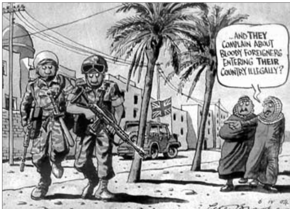
„Und die beschwerten sich noch über verdammte Ausländer, die ihr Land illegal betreten?“ Aus „The Times“, London