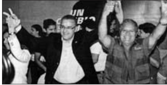
Die Sieger: Mauricio Funes (links) und Ex-Comandante Sanchez Ceren nach Bekanntwerden der Wahlergebnisse