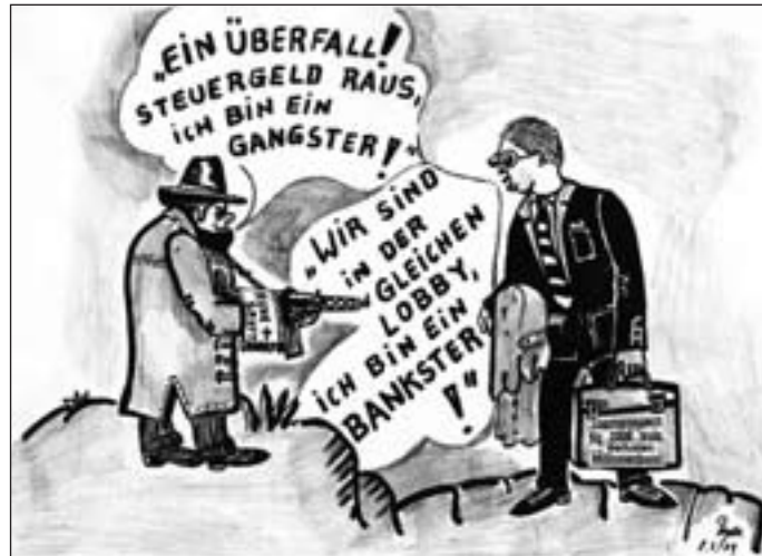
Karikatur: Heinrich Ruynat

Erich Buchholz: Strafrecht im Osten. Ein Abriß über die Geschichte des Strafrechts der DDR. Kai-Homilius-Verlag 2008, Edition Zeitgeschichte, Band 37, 662 Seiten, 58 €