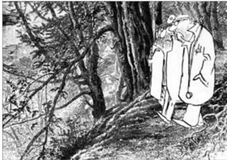
„Als Ihr Psychiater werde ich mit Ihnen ganz offen reden: Sie sind, mein Freund, vollkommen blöd. Wie geschaffen für diese Welt ...“

und Christian Führer in den Mittelpunkt der Aufmerksamkeit rückten. Loest wählt für seine Geschichtslektion die Form des Romans. Der Titel: „Löwenstadt“. Hauptheld ist – wie schon in dem früheren Roman „Völkerschlachtdenkmal“ – die Gestalt des Fredi Linden. Die Fabel schlägt den Bogen von der Völkerschlacht 1813 bis zur Gegenwart. Handelnde in den 80er Jahren