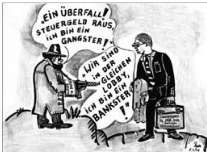
Karikatur: Heinrich Ruynat

Erich Buchholz: Strafrecht im Osten. Ein Abriß über die Geschichte des Strafrechts der DDR. Kai-Homilius-Verlag 2008, Edition Zeitgeschichte, Band 37, 662 Seiten, 58 €