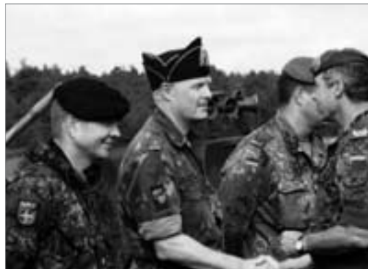
Verabschiedung der Bataillonskommandeure

und zur Durchführung aller Einsatzoptionen in der Lage sein.