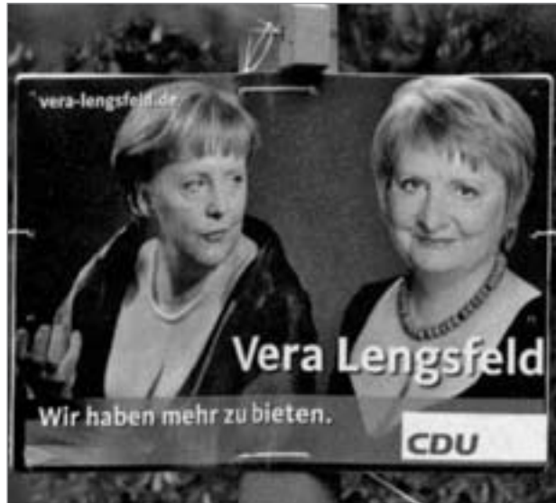
Freizügiges CDU-Wahlplakat im Sommer 2009. Inzwischen sind die beiden Damen, die tief blicken lassen, einander spinnefeind

Erfreut war ich auch, daß so viele Menschen die Veranstaltung besuchten. Etliche Redebeiträge waren interessant und klug oder machten mich nachdenklich.