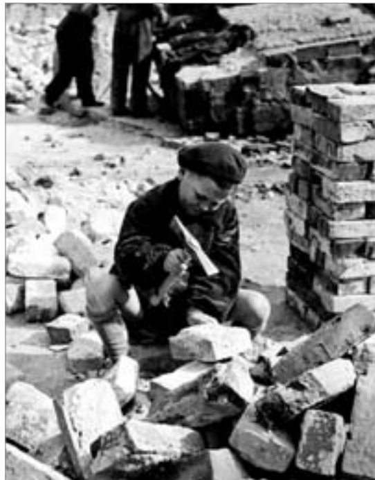
Kleiner Aufbauhelfer 1945

Nach der Entfernung der Hitlerfaschisten aus dem Schuldienst standen zur Wiederaufnahme des Unterrichts 140