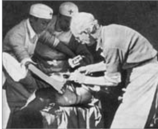
Dr. Bethune operiert einen verwundeten Soldaten

Aspekte von Krankheitsbildern. Während der Jahre der Großen Depression gewährte er Tausenden mittellosen Patienten eine kostenlose Versorgung. Zugleich forderte er seine Kollegen und das Gesundheits-