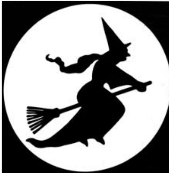
Schattenriß aus „The Guardian“, Sydney

erste Fragenkomplex überschrieben. Mit Hilfe vieler Unterfragen wie der darauf erteilten Antworten wird eine scharfsichtige Geschichtslektion vermittelt, die neben dem Wirken des eigenen Organs auch Grundfragen des Schutzes und der Verteidigung jeder Revolution betrifft. Hier geht es um das Entstehen der DDR, ihre Entwicklung, den Einfluß des „Gro-