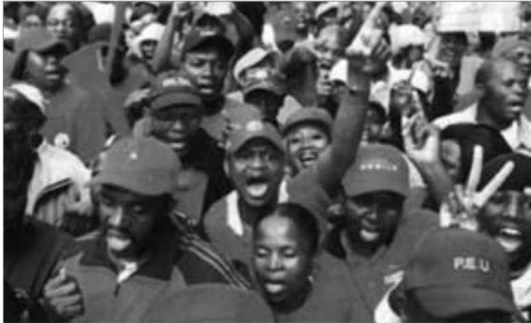
Südafrikas Gewerkschafter sind kampfbereit.