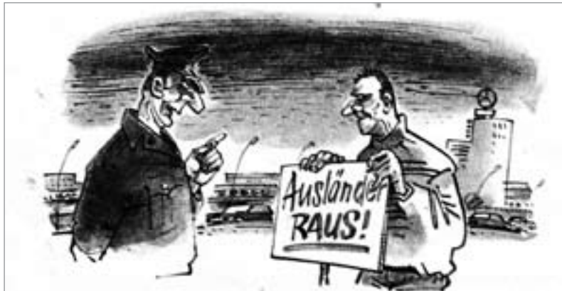
„Geht in Ordnung – aber nicht beim Besuch des USA-Präsidenten in unserer Stadt, klar?!“ Zeichnung: Rainer Schwalme (Eulenspiegel, 19/89)

Nun kann man, wenn von Bodo Ramelow die Rede ist, wahrlich nicht von einem Extremisten oder Radikalen sprechen. Und doch erfolgte seine jahrzehntelange geheimdienstliche Bespitzelung unter dem Vorwand des „Kampfes gegen den Extremismus“. Bei Feststellung der Rechtmäßigkeit seiner Observation erklärte das Bundesverwaltungsgericht zugleich die Beobachtung der gesamten PDL für legitim – wegen angeblich verfassungsfeindlicher Bestrebungen. Als Beweise dienen die Abneigung gegen Gauck als Bundespräsidenten, die Solidarität mit