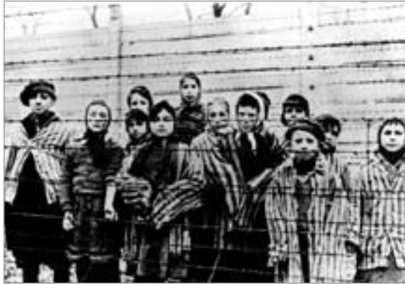
Diese Kinder überlebten die Ausrottung von Millionen Menschen in Auschwitz durch die deutschen Faschisten.

Wiederauferstehen des deutschen Faschismus zur Folge haben. Demgegenüber hatten bekanntlich die maßgeblichen antifaschistischen Politiker und deren Parteien in der sowjetischen Zone mit Unterstützung