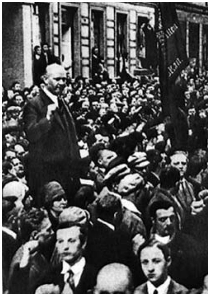
Thälmann spricht am 1. Mai 1930 zu Arbeitern im Berliner Wedding.

sein. Letzteres soll nach dem Willen der Bundesregierung noch bis 2019 so bleiben. Inzwischen sind aus dem rechtskonservativen Lager sogar Forderungen zu hören, die Partei Die Linke vom Verfassungsschutz flächendeckend bespitzeln und ein Verbot der Partei prüfen zu lassen. Ich schließe nicht aus, daß es einen inhaltlichen Zusammenhang zu der jüngsten „Extremismusklausel“ der Bundesregierung gibt, die letztlich auch den Widerstand junger Leute gegen Naziaufmärsche brechen soll.