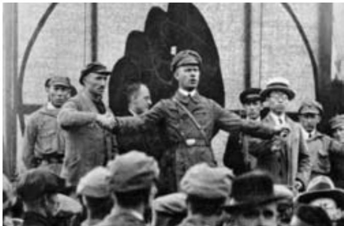
Ernst Thälmann mit einem sowjetischen Seemann und einem chinesischen Arbeiter auf dem RFB-Gautreffen Wasserkante am 21. Juni 1925 in Hamburg

Diese mutige Haltung regt mich zu der Frage an: Wie verhielten sich