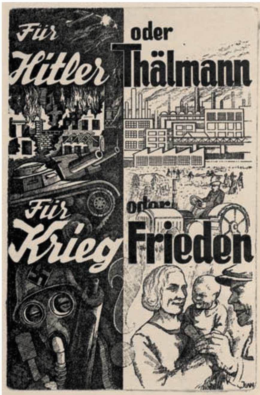
Umschlagseite einer Broschüre des Internationalen Befreiungskomitees für Thälmann und alle eingekerkerten Antifaschisten, 1936