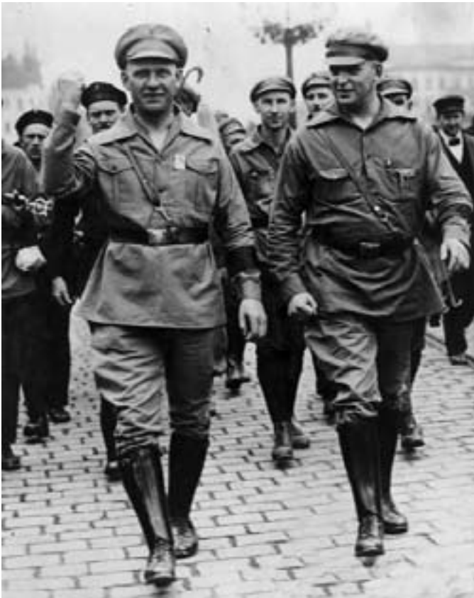
Unter Ernst Thälmanns Führung entwickelte sich der Rotfrontkämpferbund (RFB) zu einem 300 000 Mitglieder zählenden antifaschistischen Selbstschutzorgan der Arbeiterklasse.

Sozialismus“ im Unterschied zum „utopischen Sozialismus“ – das bedeutete eben auch: Die Realität war noch weit vom erstrebten Ideal entfernt. Den Sozialismus, den wir hatten, als Kommunismus zu bezeichnen, zu unterstellen, die Vision sei schon Wirklichkeit gewesen, ist mehr als unredlich. Manches in der aktuellen Diskussion erweist sich als politischer Rufmord. Ich traute meinen Augen nicht, als ich einen Bericht über die von der „jungen Welt“ veranstaltete Rosa-Luxemburg-Konferenz las. „Am vergangenen Wochenende“, so hieß es in der „Frankfurter Rundschau“, „haben rote Faschisten sich in Berlin zur Diskussion getroffen.“ Mit Verlaub: War der Redakteur besoffen? Wem gab er dieses entsetzliche Etikett? 2000 vorwiegend jungen, nach dem Sinn ihres Lebens suchenden