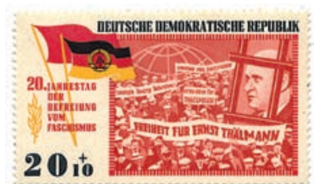
Briefmarke der DDR von 1965