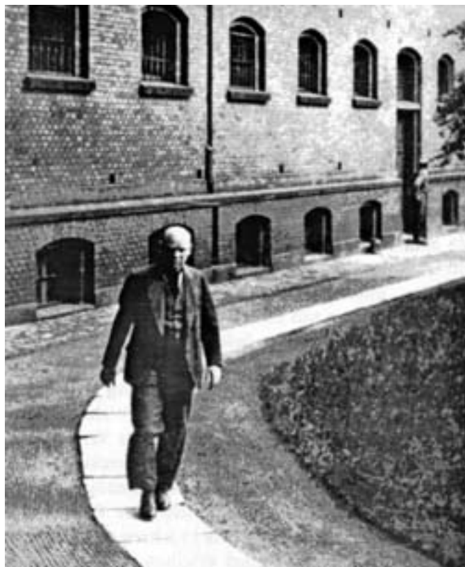
Ernst Thälmann beim Freigang im Hof des Untersuchungsgefängnisses Berlin-Moabit, wo er von Mai 1933 bis August 1937 eingekerkert war

„Größe und Tragik eines Arbeiterführers“, überschrieb die Zeitung „Neues Deutschland“ vor fünf Jahren einen Artikel zum 120. Thälmann-Geburtstag. Die Tragik Thälmanns, so denke jedenfalls ich, war seine Ermordung auf Befehl Hitlers und die Tatsache, daß diese nicht verhindert werden konnte. Doch davon ist in dem Artikel