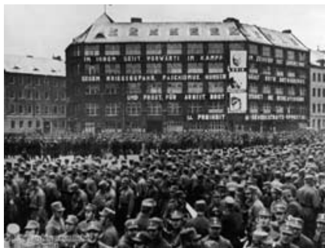
Gebäude des von Arbeitern geschützten ZK der KPD. Das Karl-Liebkecht-Haus wird von SA-Horden belagert.