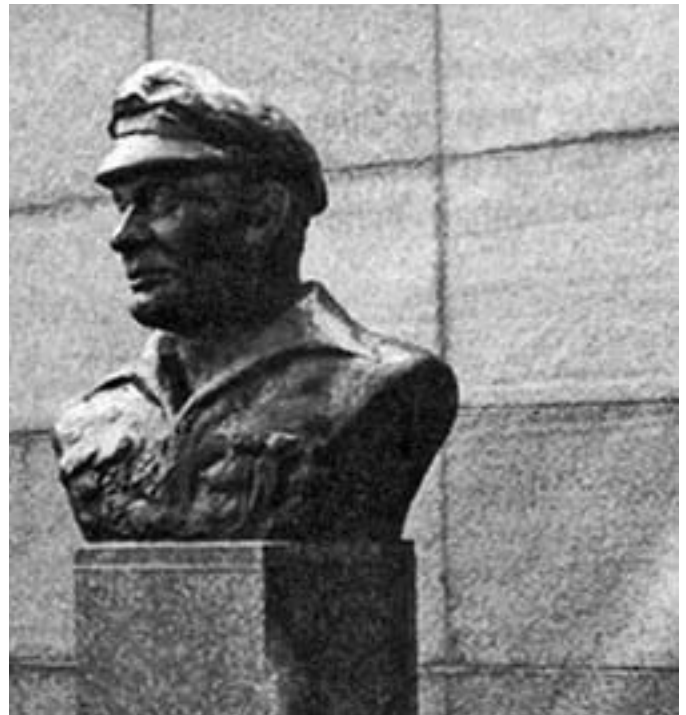
Thälmann-Büste in der mittlerweile im Ergebnis der Konterrevolution geschleiften Gedenkstätte Ziegenhals

Wo Kritik an Thälmann notwendig ist, bin ich lernfähig. Sie wird aber undialektisch, wenn sie nicht im historischen Kontext steht, unter Bewertung der nationalen und internationalen Situation, in Kenntnis der harten politischen Auseinandersetzungen seiner Zeit erfolgt. In der Ausgabe des ND vom 16. April 2011 wiederholt der Autor des Artikels von vor fünf Jahren wesentliche Positionen seiner Sicht auf Ernst Thälmann. Er bemerkt aber auch, die Linke werde Thälmann „weder den Antikommunisten noch den stalinistischen Apologeten“ überlassen. Doch ich fürchte, daß unter dem Mantel des „Kampfes gegen den Stalinismus“ versucht wird, Thälmanns historische Rolle zu verkleinern. Unter dem Strich bleibt dann nur noch das aus Wahrheiten, manchen Halbwahrheiten und viel