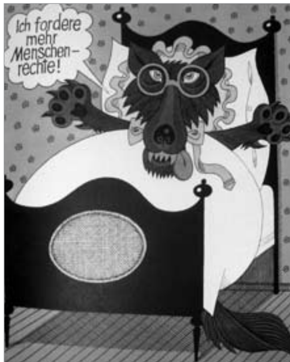
Karikatur von Louis Rauwolf

DDR durchaus am Herzen lag und die eine Rückkehr zur kapitalistischen Vergangenheit kategorisch ablehnten, ändert nichts daran, daß gerade auch jene unter falscher Flagge gesammelt und für staatsfeindliche Handlungen mobilisiert werden sollten, was auch geschah.