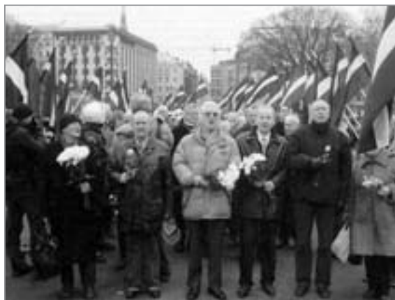
Baltische Faschisten: Aufmarsch von Angehörigen der lettischen Waffen-SS in Riga, März 2009

von der „neuen Ordnung“ erwarteten. Auf unsere Fragen nach den realen Möglichkeiten zur Erfüllung dieser hochgesteckten Wünsche bekamen wir zur Antwort: „Wir werden Schweine an die EU liefern.“ So einfach stellten sich auch viele andere Litauer den „Wechsel“ vor. Nur die Älteren blickten nachdenklich drein. Unser Hinweis, daß es in der EU, zu der die litauischen Nationa-