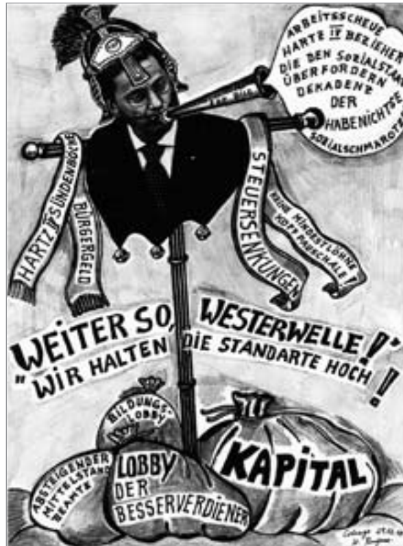
Collage von Heinrich Ruynat

unwissender Fremdhandwerker, mußte sein Fahrzeug unverzüglich entfernen. Gipfel des Ganzen: Der Direktor weilte gerade für mehrere Wochen im Winterurlaub weit weg von Neukölln.