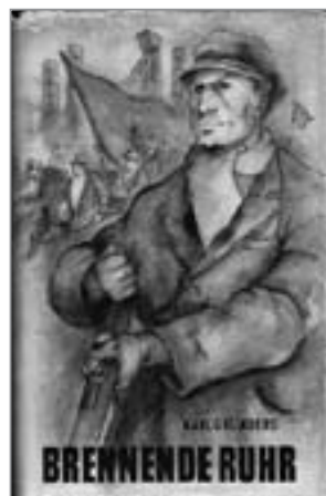
Eine der vielen Ausgaben des Buches erschien 1953 im Verlag Neues Leben (Umschlag: Kurt Zimmermann)

Und so erschien 1928 „Brennende Ruhr“. Das Buch führt den Leser in das fiktive Swertrup irgendwo bei Oberhausen. „Im kalten Licht der Bogenlampen dampften Kokereien und Hüttenwerke, ragten