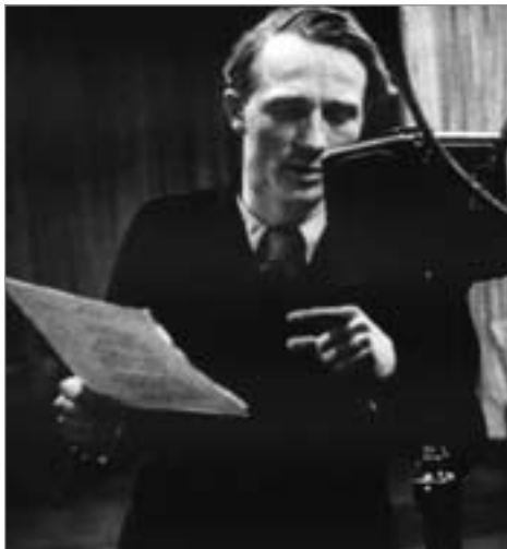
Ernst Busch am Mikrophon von „Radio Komintern“, Moskau 1936

Ich lernte Ernst Busch in einem Schlammloch der russischen Front kennen, 1943, nachts auf dem Rückzug der geschlagenen faschistischen Armeen durch die Ukraine. Ich war naß, ich fror, ich hatte Hunger. Ich war müde, verlaust, apathisch, interesselos. Ein Lautsprecher eines Propagandatrupps der Roten Armee begann eines seiner Fünf-Minuten-Programme. Nachrichten, Informationen. Danach kam ein Lied von einer abgespielten Schallplatte über schrillen Lautsprecher aus