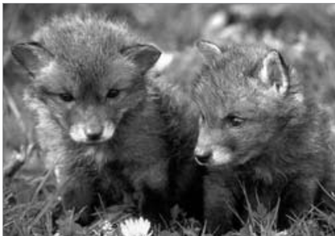
Neue Rotfuchse wachsen immer wieder auf ...

Archie hatte verlernt, das Wichtige in der