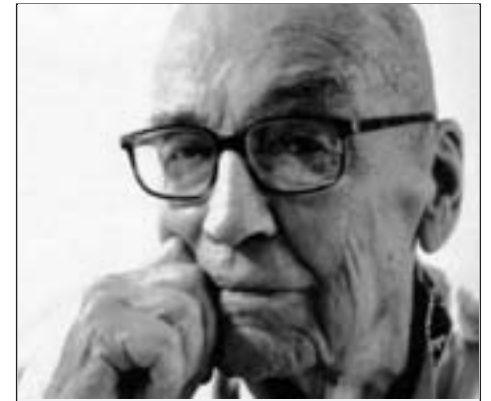
Am 7. Juni begeht der Nestor der „RotFuchs“-Autoren, Genosse