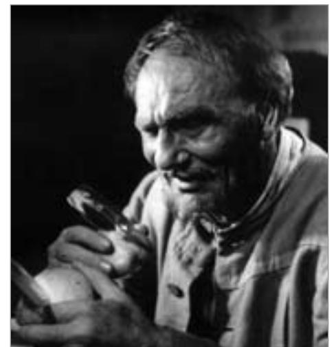
Ernst Busch als Galilei (1957)

Buschs Stimme ist unvergeßlich, Kipphardts Faszination ist begründet und schriftlich dokumentiert. Aber wie geht es weiter? Was sagen die Nachgeborenen heute, kann die Vernunft, die Wahrheit noch triumphieren?