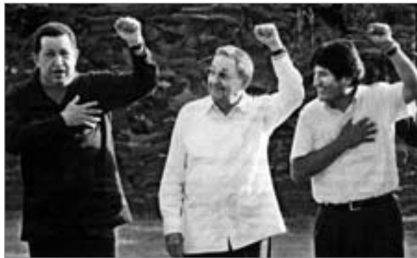
In einer Reihe für ein vom Imperialismus befreites Lateinamerika: die Präsidenten Venezuelas Hugo Chávez, Kubas Raúl Castro und Boliviens Evo Morales

Die Mehrheit der Anwesenden stimmte dann für die Gründung einer „5. Internationale“ als „Zentrum für sozialistisch ausgerichtete Parteien, Bewegungen und Strömungen“, in dessen Rahmen eine gemeinsame Strategie für den Kampf gegen