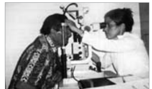
Eine kubanische Augenärztin untersucht einen Patienten in Panama-Stadt