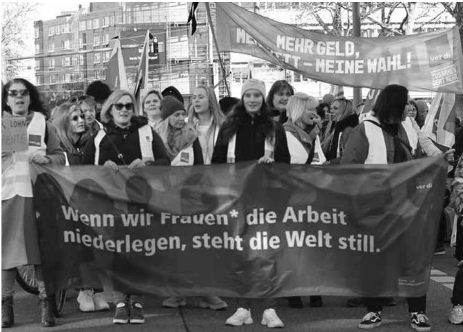
Verdi-Streiktag für Frauenrechte am 7. März

sen, daß wir sie zur Kenntnis nehmen. Sie entfalten ihre Wirkung auch ohne uns zu fragen. Außerhalb und unabhängig von unserem Bewußtsein. Das Unangenehme: Sie benutzen uns dabei auch noch. Sie machen Gewinner aus uns, Verlierer oder gar Opfer und lassen uns dabei kräftig mittun. Sie plagen uns um so mehr, je länger wir uns weigern, ihre Existenz und ihre Macht anzuerkennen. Sie sind dann wie Krankheiten, von denen wir nichts wissen wollen. Die besonders dort überaus grausam zuschlagen, wo sie nicht behandelt werden.