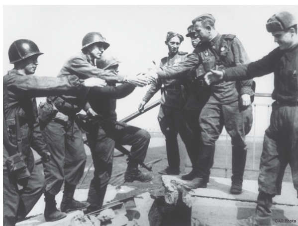
Torgau, 25. April 1945

Kahl die politische Katze aus dem Sack und erklärte im Staatsender „Deutsche Welle“, aus europäischer Sicht sei es wünschenswert, daß der Ukraine-Krieg bis mindestens 2029 weitergeht.