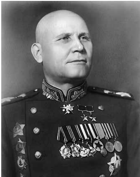
Marschall der Sowjetunion Iwan Konew im Jahr 1945

So wurde es notwendig, in einer letzten Schlacht, der Berliner Operation, die faschistischen Truppen um und in Berlin zu zerschlagen, die Hauptstadt des faschistischen Staates einzunehmen und das deutsche Volk von ihm zu befreien. Der Plan der Berliner Operation wurde im sowjetischen Generalstab frühzeitig während der Weichsel-Oder- und Pommerschen Operationen im März 1945 ausgearbeitet und mit den Oberbefehlshabern der vorgesehenen Fronten koordiniert und präzisiert. Sie erfolgte unter