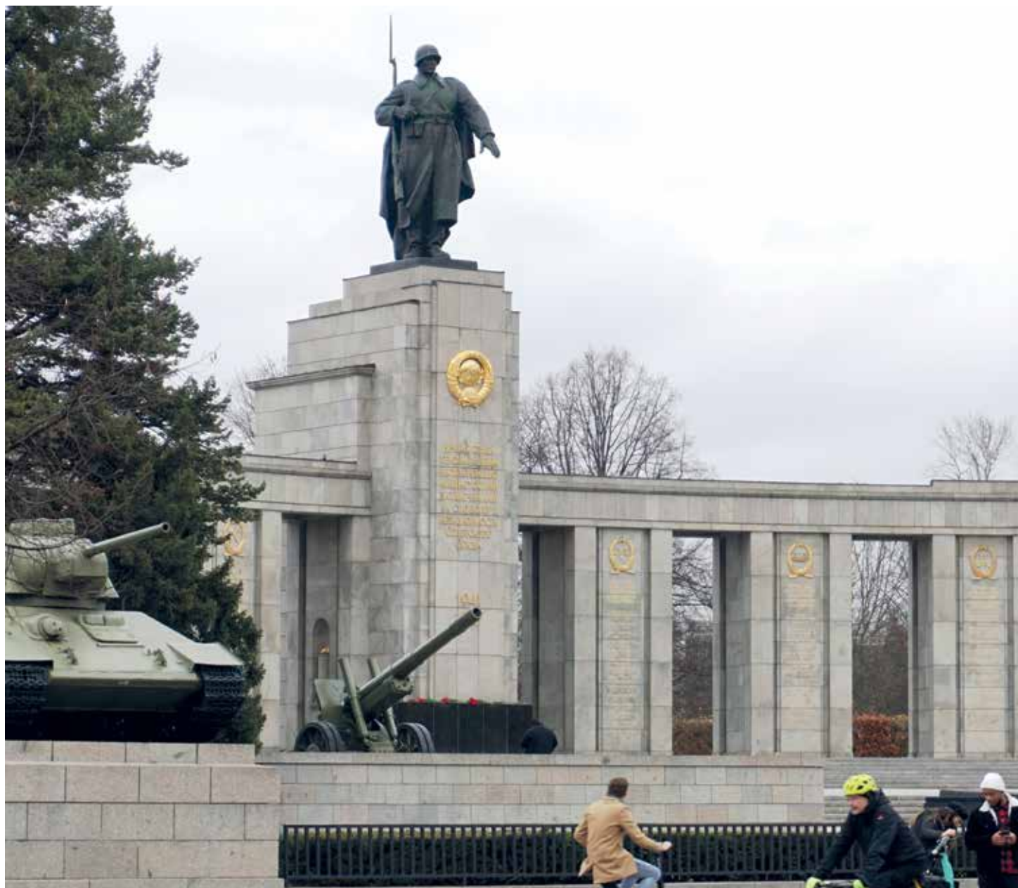
Sowjetisches Ehrenmal in Berlin-Tiergarten