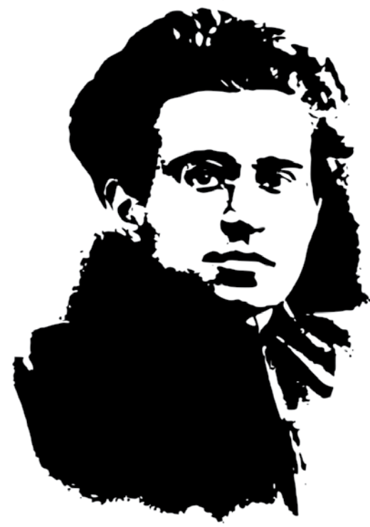
Antonio Gramsci (1891–1937)

In diesem Fall stünde die Gemeinnützigkeit in Frage, was sowohl rechtliche wie finanzielle Konsequenzen nach sich ziehen würde. Die Anfrage ist legitim, hat aber zunächst reflexhafte Proteste ausgelöst. Der neue SPD-Fraktionsvorsitzende Lars Klingbeil: „Ich kann mir keine Situation vorstellen, wo wir morgens in Arbeitsgruppen zusammensitzen und über Inve-