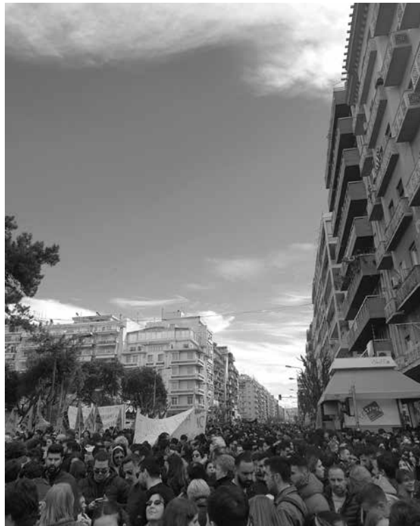
Großdemonstration im griechischen Thessaloniki am 8. März

sondern eher die Güterverkehrsstrecken für den Panzertransport, den man so herbeizusehnen scheint. Viel Geld, von dem man im Grunde nichts für die Menschen Nützliches erwarten darf. (...) Was diese Nummer aber auf jeden Fall kann, ist, den finanziellen Spielraum für künftige Regierungen auf null zu bringen. Dabei sollte man sich bei der Gelegenheit mal daran erinnern, was der Schuldenbremse vorausging – sie wurde