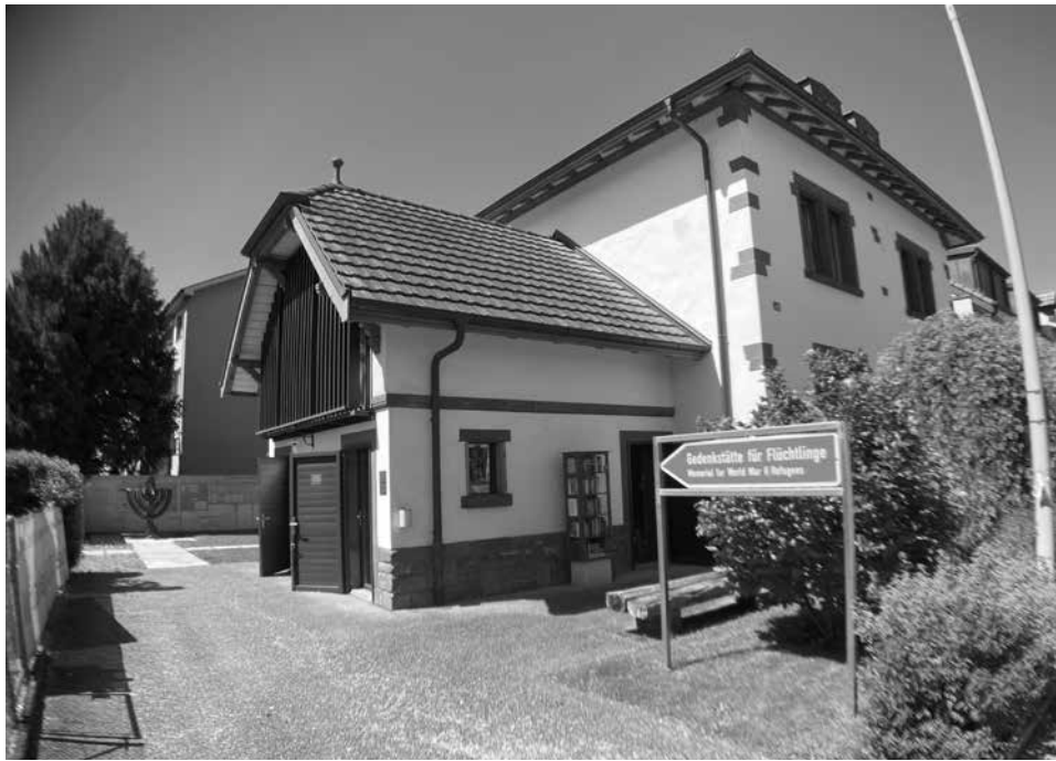
Der Badische Bahnhof

Verfolgung und Gerichtsprozesse. Wie sich doch die Dinge gleichen, auch wenn sie nicht gleich sind. Schon einmal sahen viele – zwischen 1933 bis 1939 – den Ausweg nur in der Flucht aus Nazi-Deutschland. Illegale Grenzübertritte mit und ohne, wenn auch mit gefälschten Papieren, waren für sie der einzige Ausweg, um den Häschern zu entkommen. Dramatische Geschichten spielten sich dabei an der deutsch-schweizerischen Grenze ab. Im Mittelpunkt stand die Stadt Basel mit deren besonderen Grenzverlauf. An ihr entschied sich damals das Schicksal vieler Menschen. Für die Flüchtlinge verband sich mit dem Grenzübertritt die Hoffnung auf Rettung. Daran erinnert z.B. auch eine Gedenkstätte für jüdische Flüchtlinge in Riehen. Der Basel-Badische Bahnhof – der Badische Bahnhof, wie er in Basel genannt wird –, wurde zu einem Fluchtpunkt der besonderen Art, da er als einzige Bahnstation der Welt nicht auf dem Territorium des Landes steht, zu dem er gehört. 1852 wurde ein bis heute geltender Staatsvertrag über die Weiterführung der badischen Eisenbahnen über schweizerisches Gebiet abgeschlossen. Schuld daran ist die historische Grenzziehung. Am Rheinknie ist der Fluß die Staatsgrenze. Deshalb gehören Kleinbasel, Bettingen und Riehen zur Schweiz, somit rückten sie ab 1933 auch in