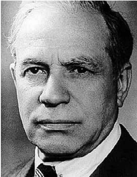
Maxim Zetkin (1883–1965)

In den 40 Jahren ihres Bestehens vermochte die DDR ein grundsätzlich anderes Gesundheitswesen aufzubauen. Obwohl sie stets aus einer wirtschaftlich stark benachteiligten Position heraus handeln mußte, konnte die DDR beeindruckende Erfolge auf dem Ge-