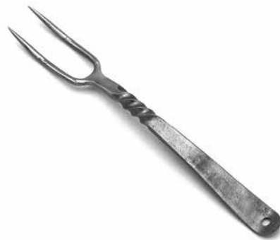
Kam aus dem Osten, war in Westeuropa also des Teufels: Gabeln aus dem Iran, 6–7. Jahrhundert

Gesellschaft teilen: Musik, Kunst, Literatur, Sprache, Werte, Bräuche, Stätten und zeitgeschichtliche Dokumente. Für die UNESCO ... ist Kultur Kern und Quelle von menschlicher Identität, Würde, gesellschaftlichem Zusammenhalt und Frieden. Kultur ermöglicht Offenheit und Innovation, um sich auf neue Herausforderungen einzustellen, sich in Krisen anpassen zu können und nachhaltige Entwicklung zu befördern. Die UNESCO definiert Kultur als „die Gesamtheit der geistigen, materiellen, intellektuellen und emotionalen Eigenschaften einer Gesellschaft oder sozialen Gruppe, die un-