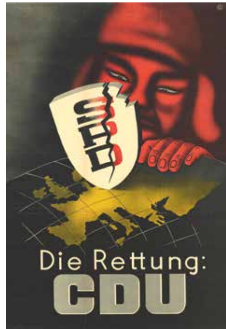
2026 ist die CDU wieder an ihrem Anfang: Wahlplakat 1949

Es geht nicht um Verteidigung. Es geht um die Durchsetzung von imperialistischen Interessen, auch wenn Gregor Gysi im Bundestag meinte, wir dürften niemals die als Kriegstreiber bezeichnen, die den aktuellen