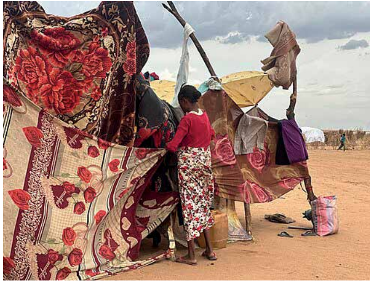
Flüchtlingslager im Sudan (Juli 2025, Nord-Dafur): Mehr als 30 Millionen Menschen benötigen unmittelbare Hilfe

Und im verbliebenen Sudan? Auch hier bekriegten sich seit drei Jahren Präsident und Vizepräsident einer selbstdeklarierten Übergangsregierung, okkupieren das von ihren Soldaten beherrschte Gebiet, beuten Bodenschätze wie Gold und Gummi Arabicum aus.