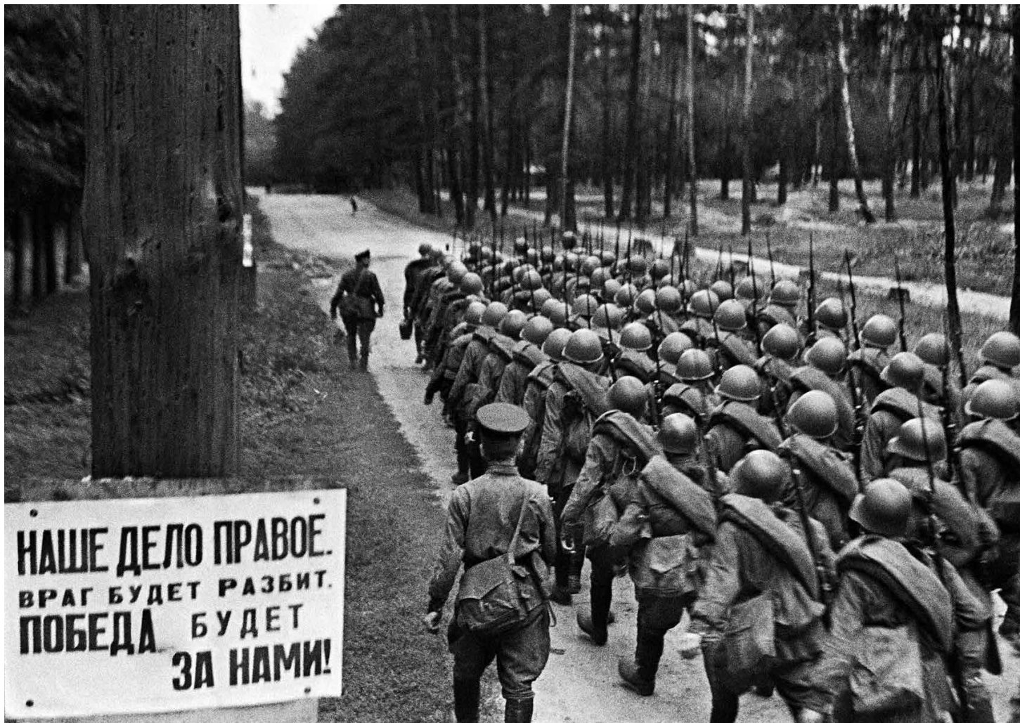
23. Juni 1941: Rekruten der Roten Armee am zweiten Kriegstag auf dem Marsch an die Front. Inschrift auf dem Schild links: „Unsere Sache ist gerecht. Der Feind wird zerschlagen. Der Sieg wird unser sein!“