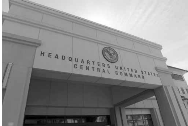
Am 1. März von einer iranischen Rakete getroffen: Das Hauptquartier des US-Zentralkommandos (Centcom) in Katar

werden. Damit wurde China zum Hauptgewinner des Irankrieges. Trotz dieser intensiven Kämpfe findet im Hintergrund der Austausch von Vorschlägen zwischen den USA und dem Iran statt, die aber wegen ihrer Widersprüchlichkeit bisher nicht zu aussichtsreichen Verhandlungen führten.