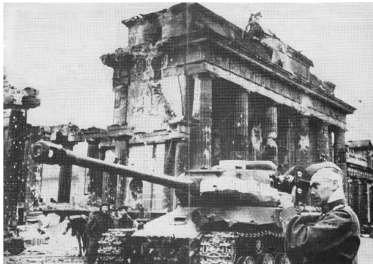
Roman Karmen im Mai 1945 am Brandenburger Tor

starben in der Kriegsgefangenschaft. Unzählige trugen schwerste Verletzungen davon, noch mehr wurden traumatisiert. 7,42 Millionen Zivilisten wurden von den Nazis in den besetzten Gebieten ermordet. 5,27 Millionen Menschen deportierten sie nach Deutschland, 2,2 Millionen davon starben dort durch Zwangsarbeit. 4,1 Millionen, verursacht durch faschistischen Krieg, starben in der UdSSR an Hunger, Krankheiten und mangelnder medizinischer Versorgung.